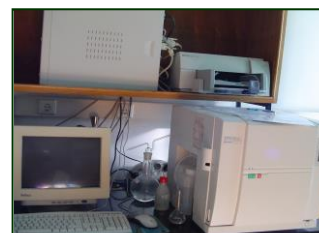
Analizator sadržaja ukupnog organskog ugljika